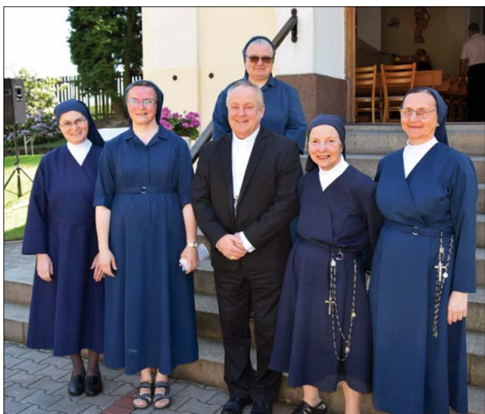
Na Mendryce se sestrami vincentkami