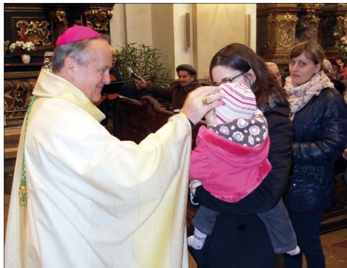
Ⓛ V dětech je budoucnost diecéze a národa

jesté rád sportoval. Vzpomínám, s jakým nadšením jste mně vyprávěl o potápění. V Římě jste prý i včelařil. Máte po 15 letech ve službě biskupa ještě čas na sebe, na svůj osobní život, a třeba i rozvoj?