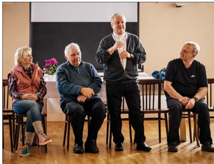
◀ Při duchovní obnově fotografického spolku Člověk a víra

náročné vybudovat nový systém hospodaření na zelené louce. Za šedesát let se všechny postupy zpřetrhaly a pokud uděláme zásadní chyby, projeví se to na mnoho dalších generací. Snažíme se vytvořit ucelený a fungující systém, zároveň je třeba zachovat základní autonomii farností, hospodář se vždy nejlépe stará o to, na co osobně dohlédne. Nejenom biskupství, ale i jednotlivé farnosti se tedy učí hospodařit se svým, mnohdy velmi skromným majetkem. Všichni si musíme uvědomovat, že majetek není danost, ale neustále se proměňuje, ztrácí či nabývá hodnotu, když něco nabudete, musíte o něco jiného přijít. Je třeba chytře investovat a každé vlastnictví zavazuje. Tlačí nás čas, protože musíme v každém roce pokrýt větší a větší mezeru po ztenčující se státní podpoře. Jedním z největších nákladů jsou ty na lidskou práci. Zároveň chceme, aby odměna všech byla důstojná a spravedlivá, což je zejména v onom přechodném období velmi náročné. Vybudovat za patnáct let soběstačný ekonomický model je skutečně veliký úkol.