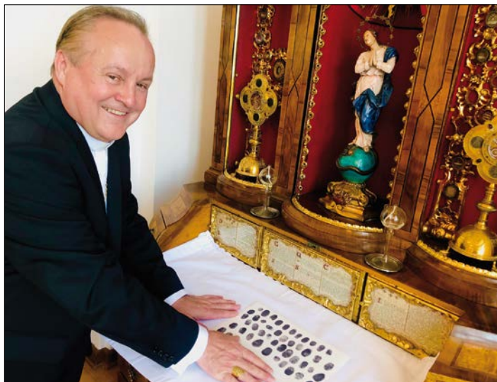
Ⓛ Biskup Jan přidal otisk prstu v rámci daru sochy sv. Anežky papeži