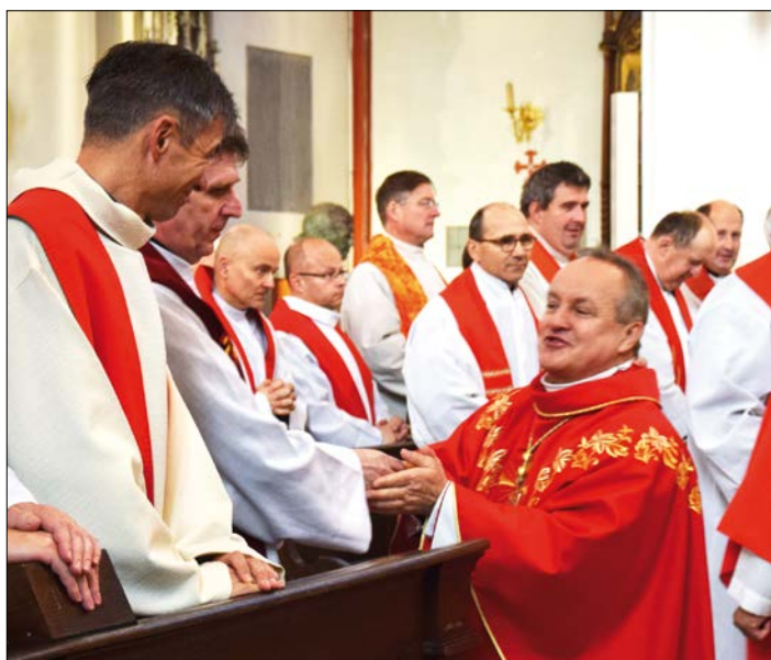
V katedrále při pozdravení pokoje