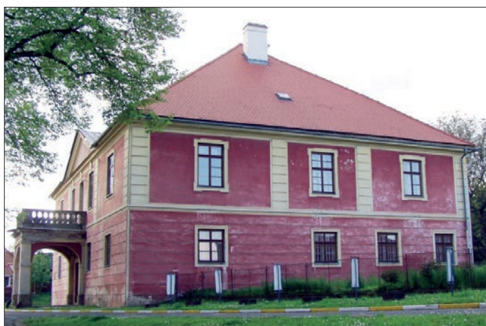
Řeholní dům Misionářů Svaté Rodiny v Holohlavech. Bývalá fara z roku 1760 je chráněná jako kulturní památka