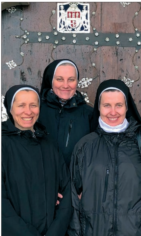
☞ Sestry Kongregace Milosrdných sester sv. Kříže, žijící v Hradci Králové

● Milosrdné sestry svatého Kříže patří do řeholní kongregace založené švýcarským kapucínem Theodosiem