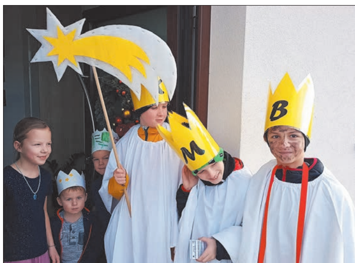
Ⓘ Tři králové na své koledě po Poličce vykouzlili nejen úsměv na tvářích dětí i dospělých a lidé je za to obdarovávali i dobrotami.