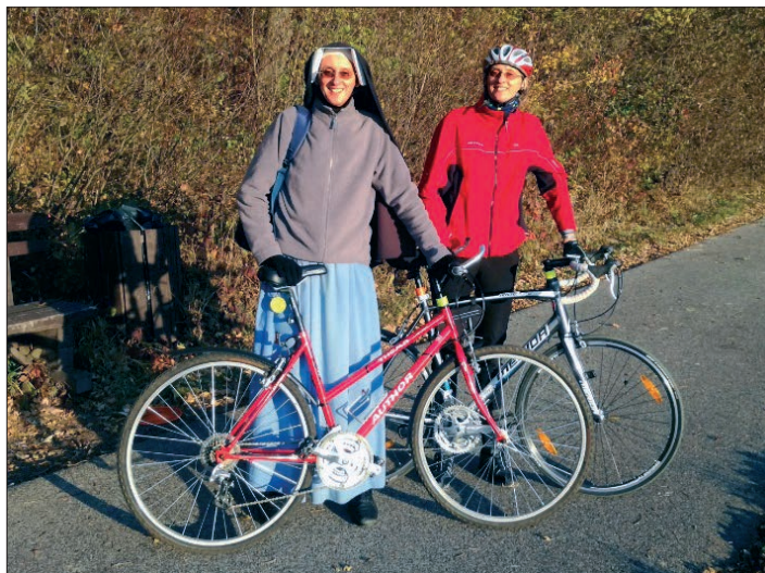
Spolu na kole