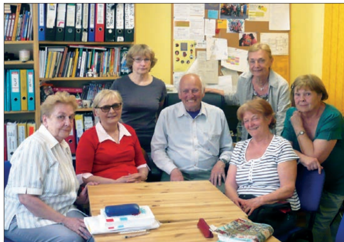
◀ Lektorem v kroužku francouzštiny pro seniorky, 2017