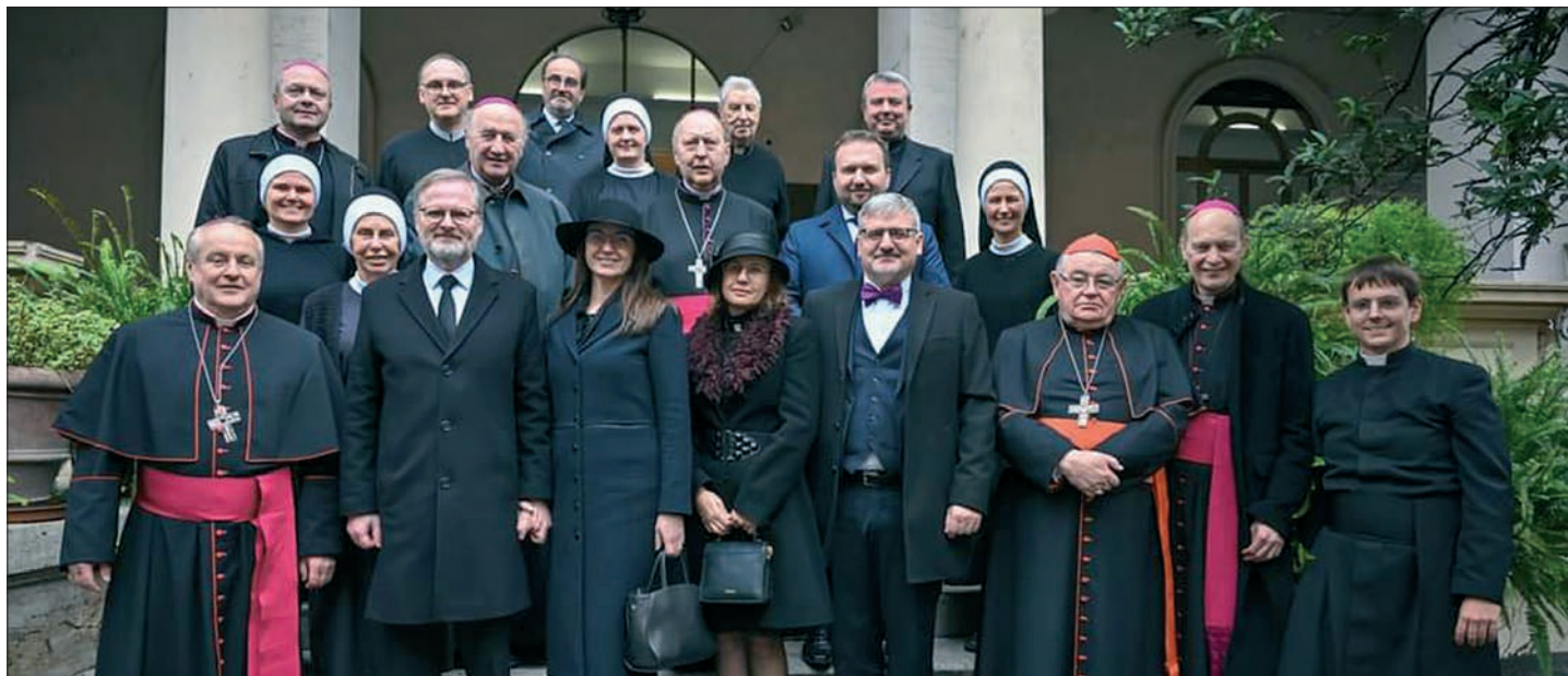
Diecézní biskup Jan Vokál se 5. ledna 2023 osobně zúčastnil s dalšími českými a moravskými biskupy rozloučení s Benediktem XVI. ve Vatikánu na Svatopetrském náměstí, kterému byl přítomen i předseda vlády ČR Petr Fiala.