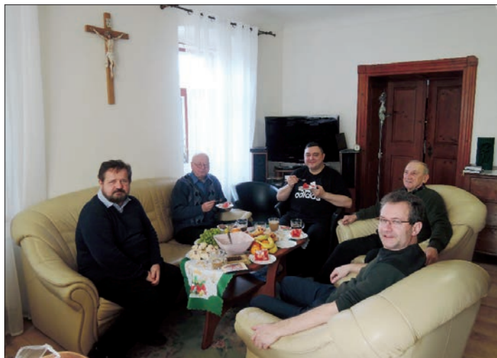
Společně prožitý čas v rámci řeholní komunity je důležité