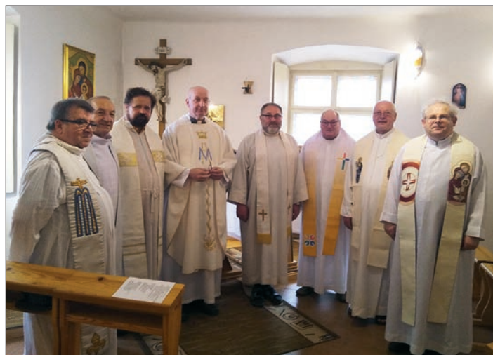
Misionáři Svaté Rodiny v komunitním domě v Holohlavech