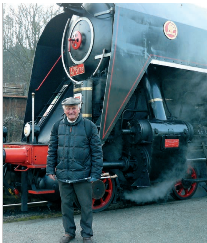
(Na nádraží s parní lokomotivou číslo 475 Šlechtična, 1995