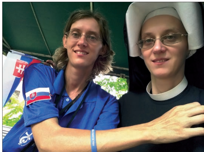
SDM, Krakov 2016

Byla jsem tam při jeho otevření a hovořila s matkou generální o svém úmyslu vstoupit do řádu. Sestry mně tenkrát vzaly věci, odvezly je do Varšavy a já tam přijela týden nato. První rok postulátu byl ve Varšavě, následovaly dva roky noviciátu v Krakově, v roce 2008 jsem složila první sliby a poslaly mě do Čech, měly jsme klášter v Praze na Vyšehradě. Tam jsem byla dva roky a v říjnu 2010 jsem poprvé přišla do Dvora Králové nad Labem.