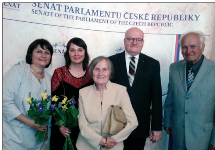
◀ Návštěva senátu