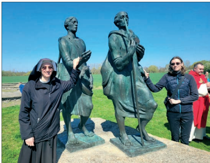
Libice nad Cidlinou, 2021