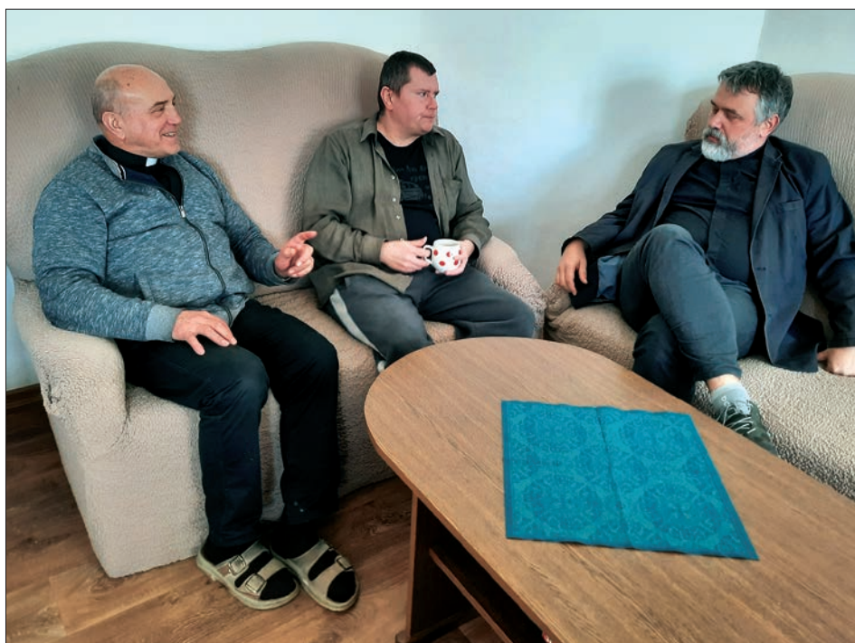
● Komunita bratří Společnosti sv. Vincenta de Paul, žijící v Dobrušce

● Salvatoriáni jsou členové Společnosti Božského Spasitele a jejich typickým rysem měla být univerzalita a soustřeďují se na duchovní službu ve farnostech.