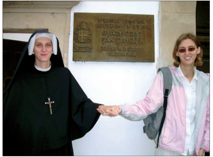
◀ Spišská Kapitula, Slovensko

„Tím, že mám hábit, vědí, že jsou v církevní budově. Dáváme jim i duchovní nabídky – návštěvu kněze, o Velikonocích připravíme nějaký program, na Mikuláše k nim přijde sv. biskup Mikuláš, kolem Vánoc uděláme Štědrý večer, ale ne takový světský. Čteme si v Bibli, vyprávíme o narození Ježíše. Kolem Třech králů kněz posvětil jejich přibytky. Žijeme s církevním rokem a oni tak nepřímo, podvědomě s námi.“