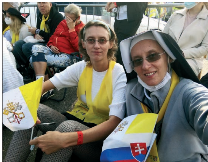
Návštěva papeže Františka na Slovensku