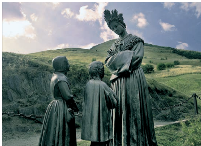
( Zjevení Panny Marie v La Salettě ve francouzských Alpách v září 1846 patří mezi nejdůležitější mariánská zjevení