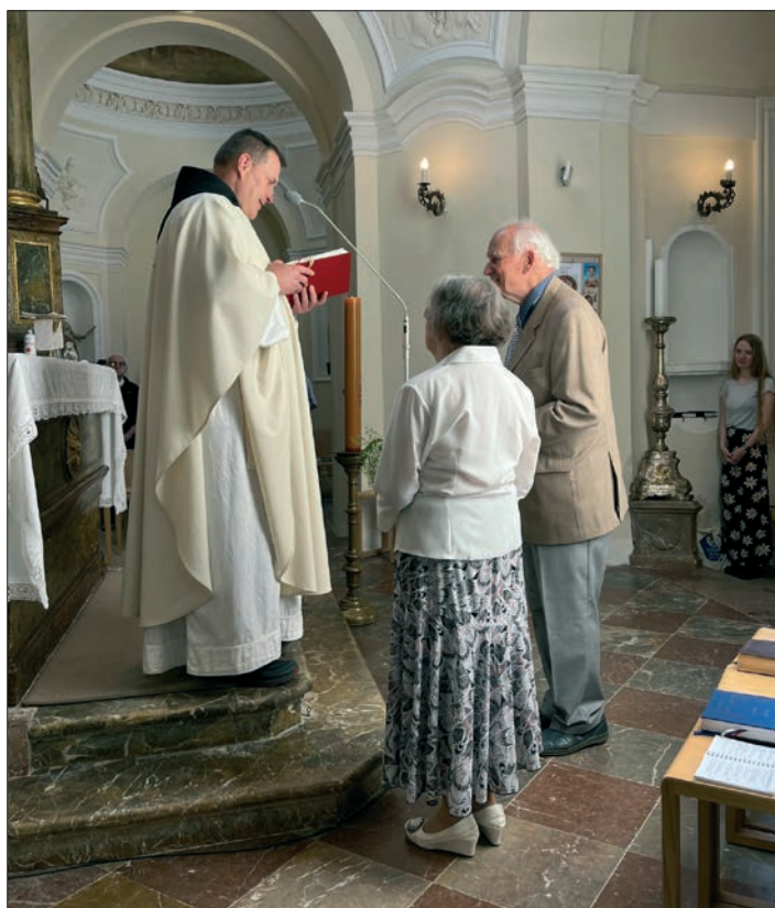
(Obnova manželského slibu při diamantové svatbě