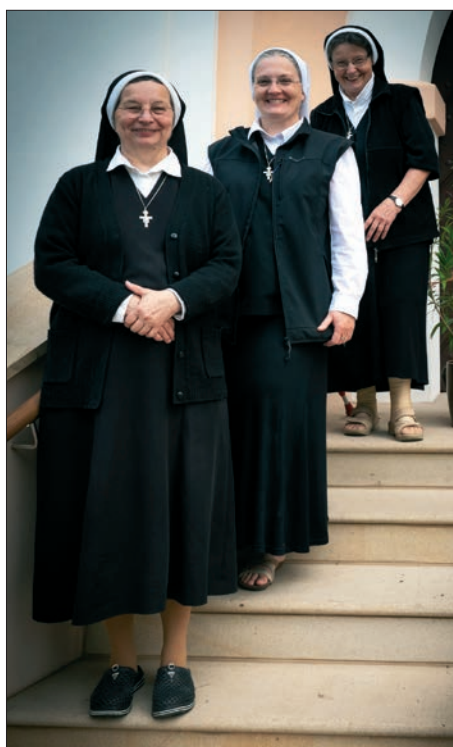
☛ Sestry Kongregace Školských sester svatého Františka, žijící v Hoješíně u Seče

• Johanité , jejichž řehole byla potvrzená ve 12. století, zdůrazňovala povinnost ochraňovat věřící, pečovat o nemocné poutníky, pomáhat potřebným a bránit Jeruzalém před muslimy.