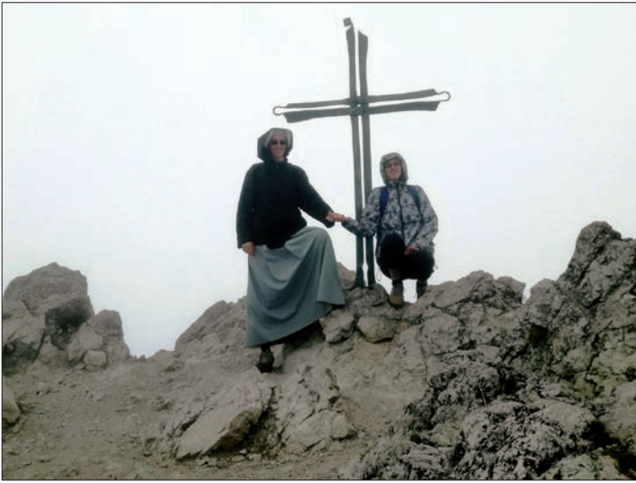
◀ Dovolená na Slovensku, Velký Rozsutec 1610 m n. m.