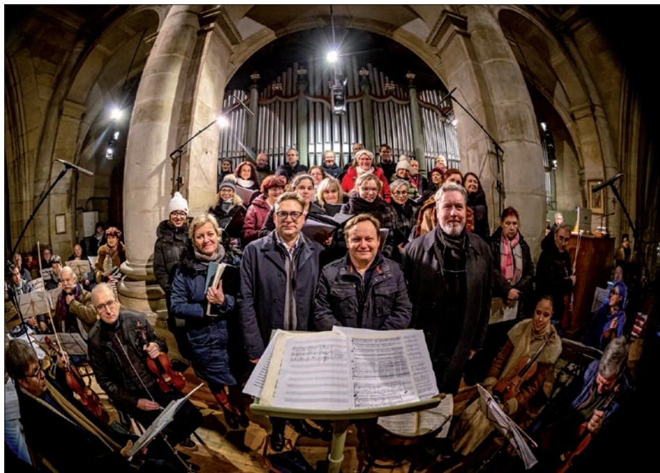
☛ Půlnoční mše svatá na kůru katedrály sv. Víta, Václava a Vojtěcha v Praze, Vánoce 2021