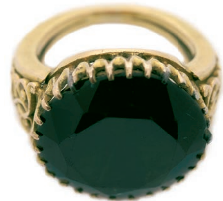
Ⓢ Biskupský prsten uložený na Biskupství královéhradeckém

Biskupský (opatský) prsten se stal znakem biskupské hodnosti zhruba v 7. století. Jeho používání potvrdila synoda v Římě roku 610. Od 9. století představoval prsten symbol vlády biskupa nad jeho biskupstvím. Díky tomu se stal jedním ze dvou předmětů (druhým byla biskupská berla), který vstoupil do boje o investituru v průběhu 11. a 12. století. Císaři Svaté říše římské si totiž dělali nárok předávat berlu a prsten novým arcibiskupům, biskupům a opatům u lenního slibu církevních hodnostářů. To ale uráželo papeže a oslabovalo moc nejvyššího úřadu v církvi. Po podpisu Wormského konkordátu z 23. září 1122 císař předával na znamení světské moci žezlo. Berla i prsten se pak staly symboly duchovní vlády.