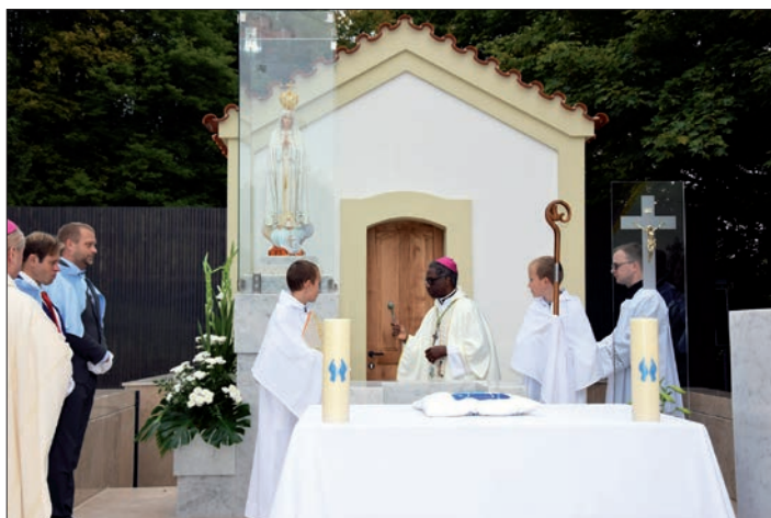
◀ Apoštolský nuncius Jude Thaddeus Okolo kapli požehnal