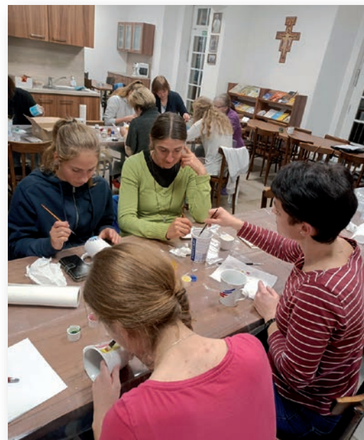
☛ Víkend pro dcery a matky