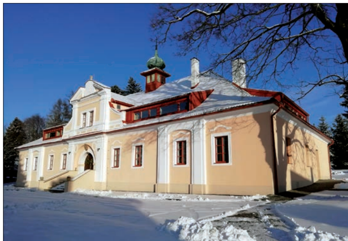
◀ Zrekonstruovaný zámek v Hoješíně