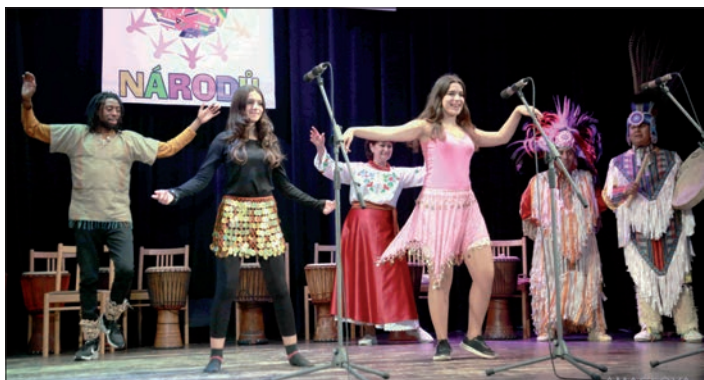
ⓘ Hlavním mottem letošního 9. ročníku festivalu Setkání národů bylo „Protančíme spolu celý svět“.