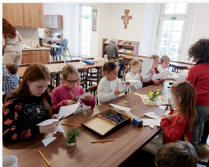
☛ Liturgické tvoření