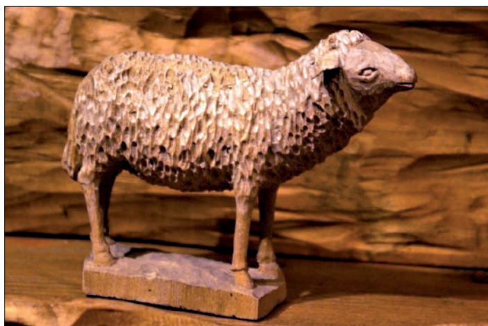
Řezbářská práce je provedena do detailu