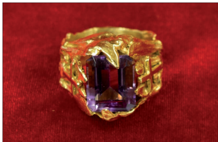
(Prsten z odkazu kardinála Miloslava Vlká uložený na Biskupství českobudějovickém.)