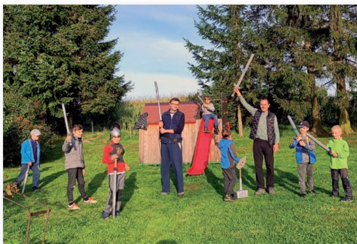
☛ Setkání schönstattských rodin