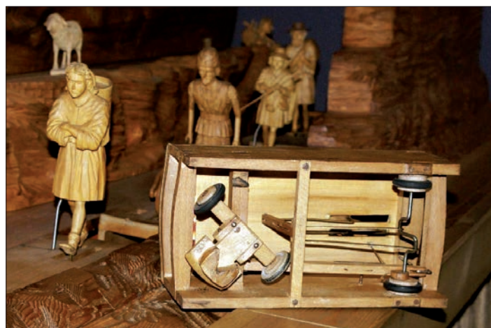
Důvtipná mechanika Utzových vozíků pro figurky daráků