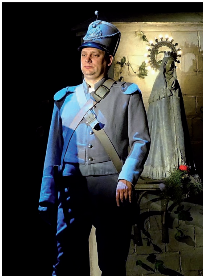
77 Národní divadlo v Praze, představení Carmen, voják (2016)