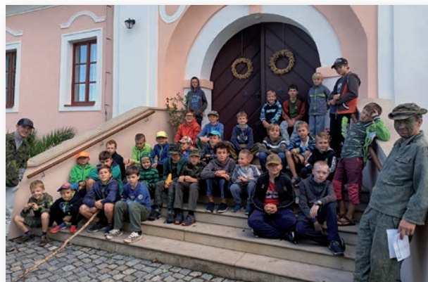
( Duchovní víkendovka pro kluky v duchu Boje o přežití