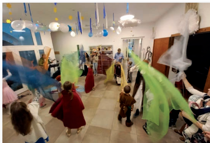
( Na Bál všech svatých přišlo 40 malých i velkých světic a světců z našeho okolí