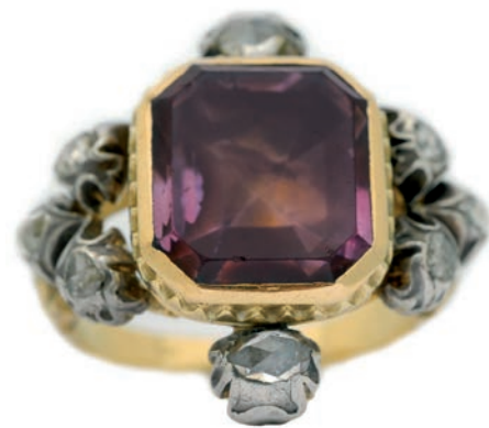
Ⓢ Biskupský prsten uložený na Biskupství královéhradeckém

Z tohoto hlediska je proto zvláštní kardinálský prsten , který dává papež kardinálům. V minulosti byl ozdoben safírem, jenž byl obtočen věncem diamantů, nebo erbem kardinála či jeho monogramem, neboť kardinál byl knížetem Církve.