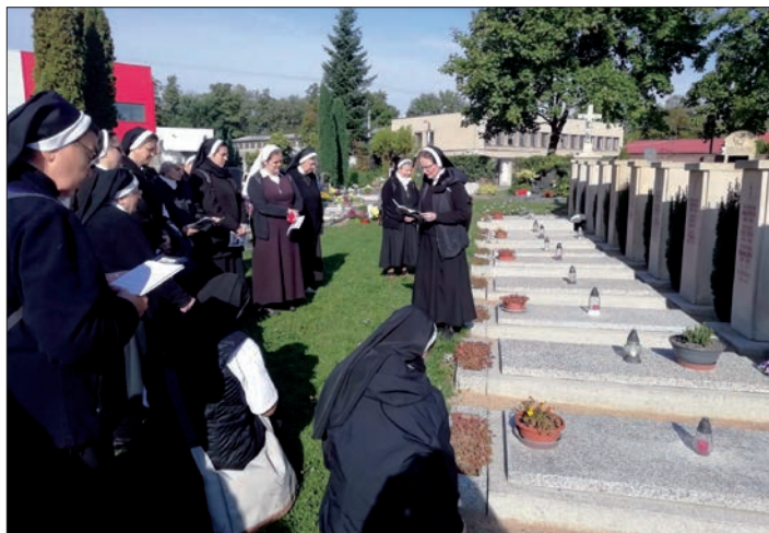
Řeholnice nezapomínají na své zemřelé sestry