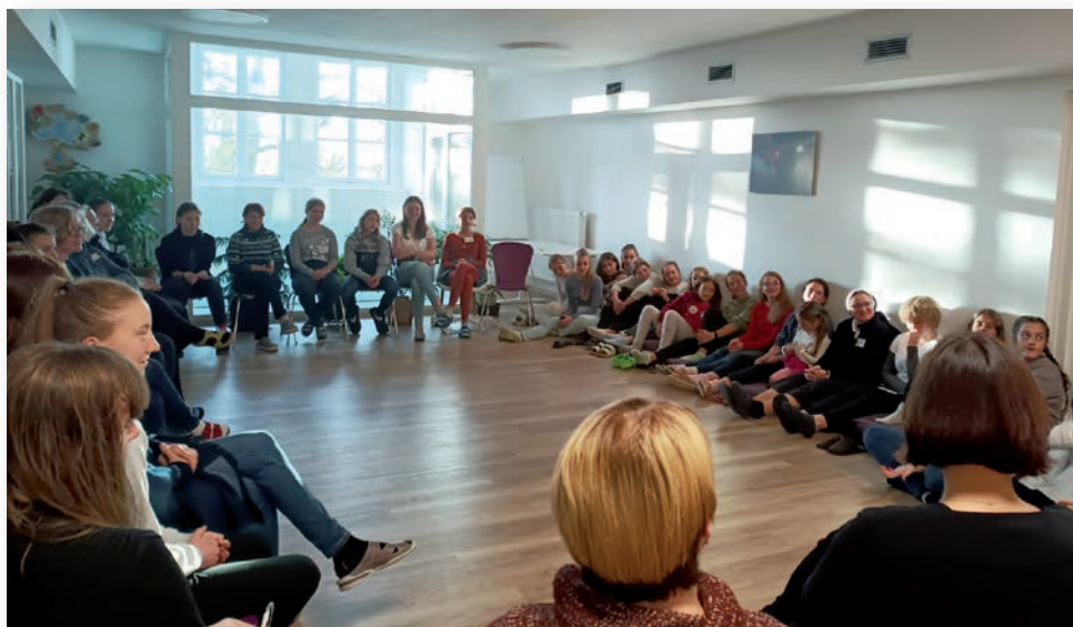
( Naše mladé sestry (juniorky) připravily víkend pro děvčata 13+ na téma Pro koho bije moje srdce