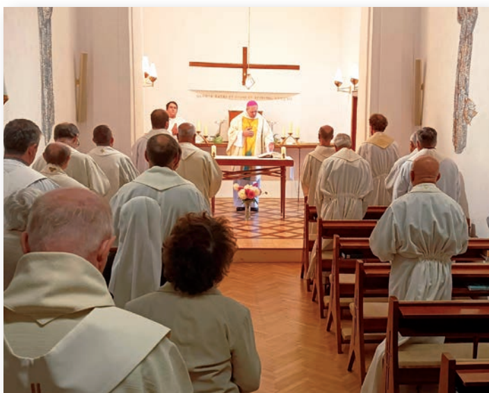
☛ Rekolekce pro kněze