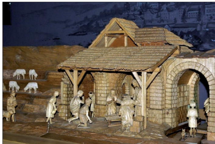
Obdarování Ježíška v Utzově mechanickém betlému