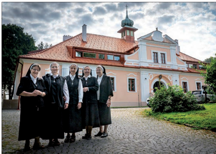
◀ Vždy dobře naladěné