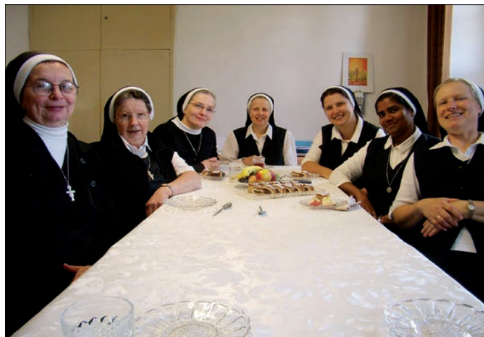
◀ Komunita hoješinských sester je vždy připravena přijmout hosty