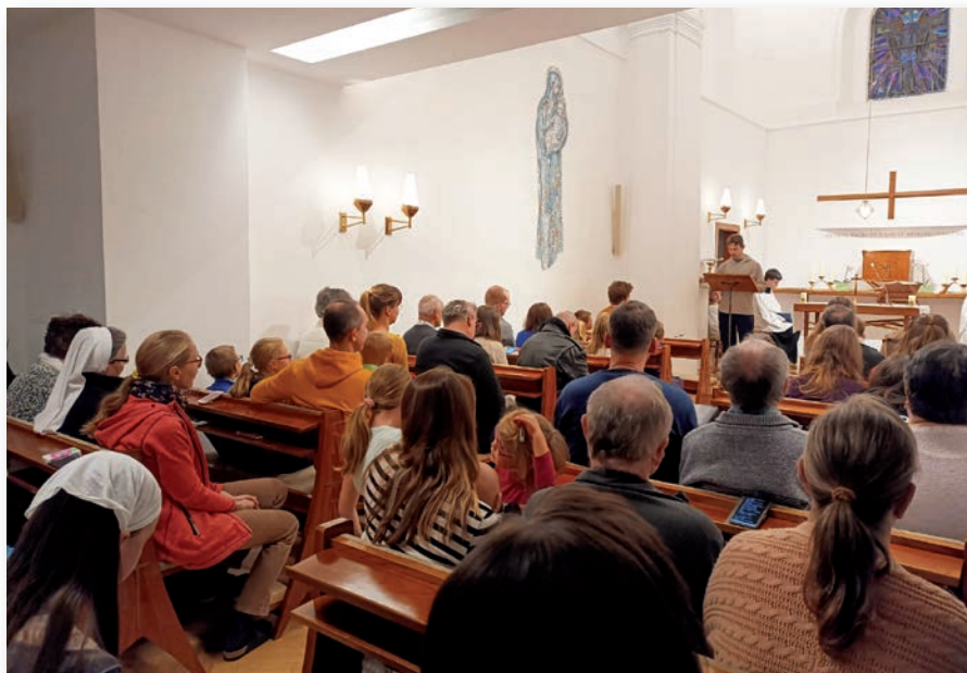
☛ Konference Liga Pár páru