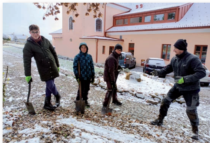
☛ Malí brigádníci