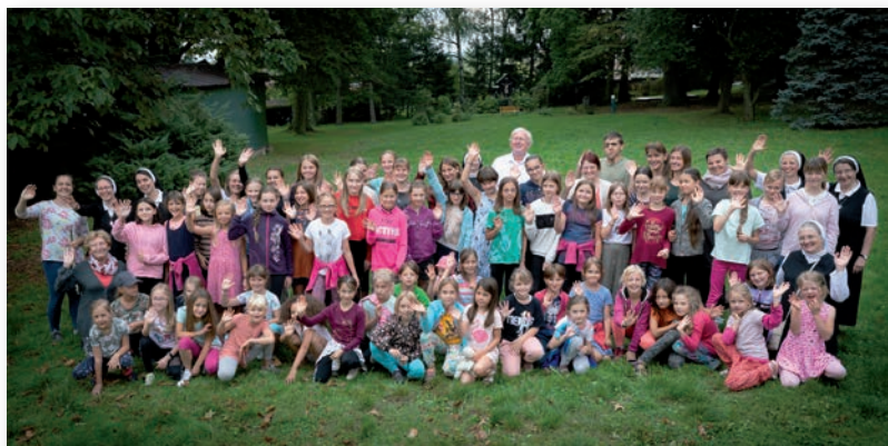
( Duchovní víkendovka pro děvčata od 7 do 12 let na téma Stačí málo – naše vztahy

Smích, zpěv a dětský křik neustával ani po prázdninách. Jsme rády, že můžeme naplňovat heslo naší zakladatelky: Jsme tu s Bohem pro vás! Zdraví vás Školské sestry sv. Františka.