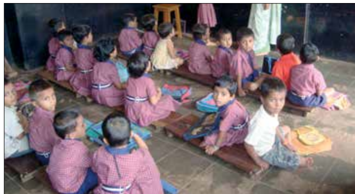
( Indické děti podporované v projektu Adopce na dálku.