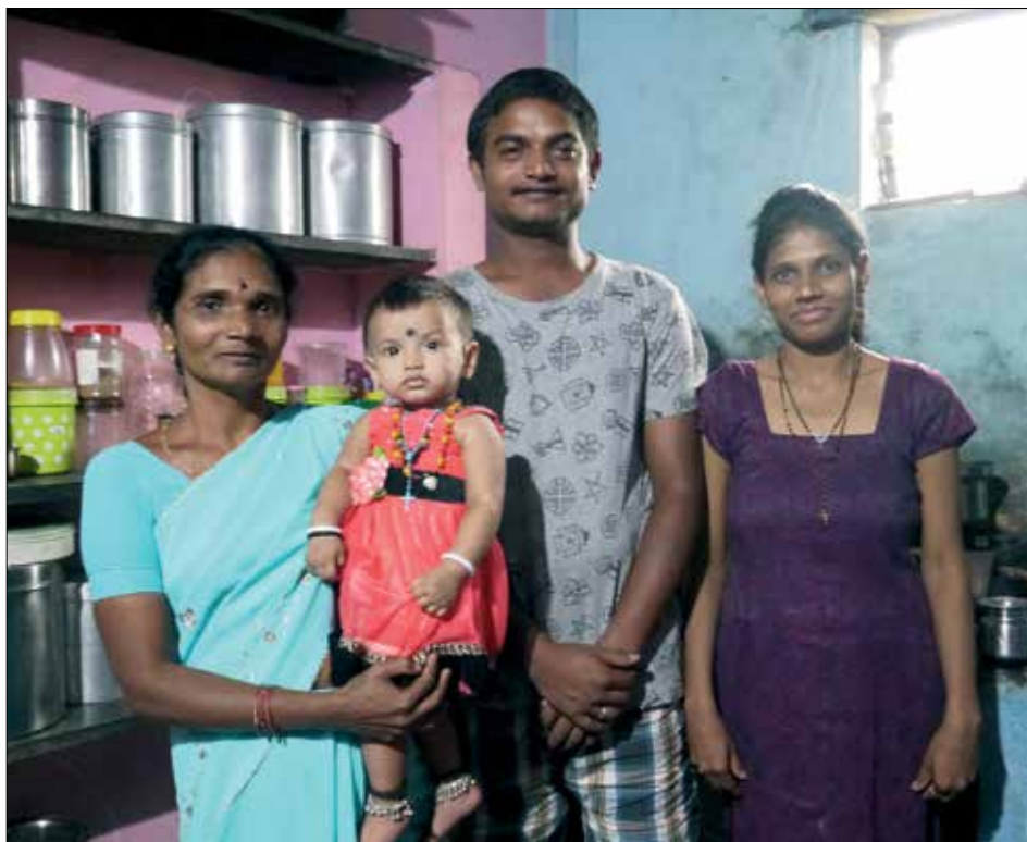
( Návštěva rodin v Belgaum