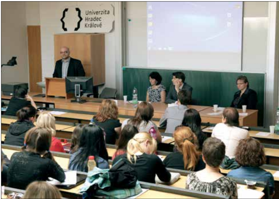
◀ Dnešní teologický institut