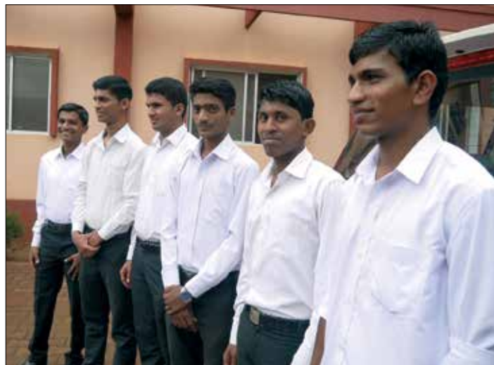
Divine Mercy, studenti teologie