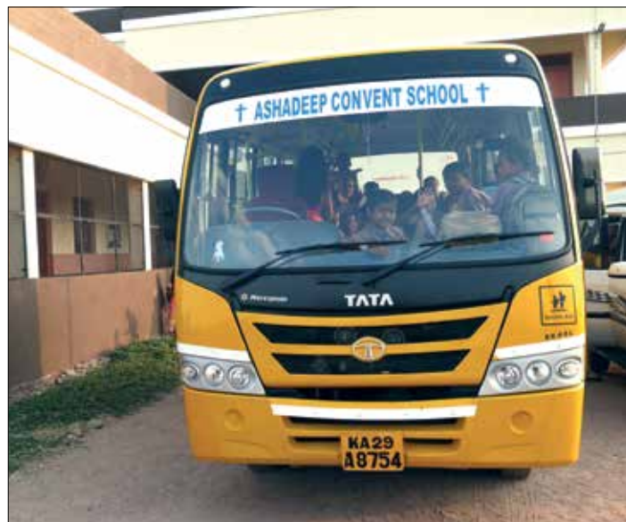
◀ Assangi, školní autobus