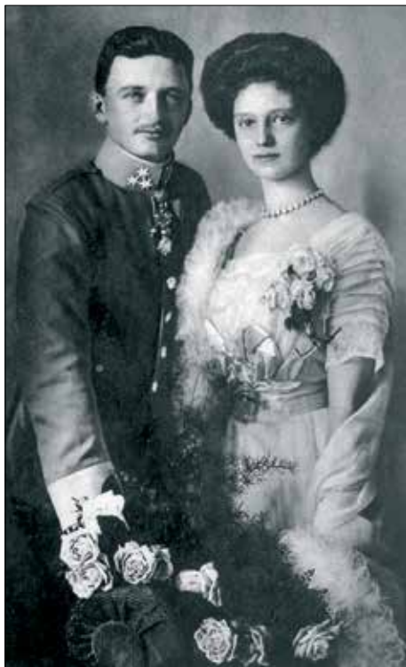
☛ Rakouský císařský pár - Karel I. Habsburský s chotí Zitou

Habsburská monarchie dostala od Boha v osobě svého posledního císaře, blahoslaveného Karla I. Habsburského, člověka, který chtěl „vždy a ve všem plnit Boží vůli“, a státníka, který významně přispěl ke konci první světové války, o což už ostatně v prorocké vizi požádal jeho snoubenku Zitu Bourbonso-Parmskou při soukromé audienci papež svatý Pius X., a to ještě před samotným vypuknutím války a v době, kdy Karel rozhodně nebyl první v pořadí jako nástupce císaře Františka Josefa I. Karel zemřel 1. dubna 1922 v pouhých 34 letech ve vyhnanství na Madeiře.