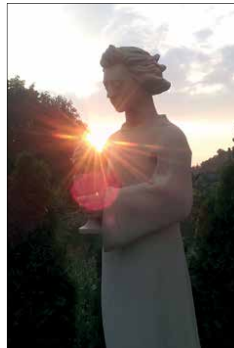
☛ Anděl Míru v Koclířově

lidských utrpení. Tlouklo mi srdce a byl jsem naplněn velikou vděčností, když jsem mohl na vlastní oči vidět stovky a tisíce lidí, kteří se chtěli přiblížit k Panně Marii. Nejednalo se o nějaký rozrůzný dav, jako tomu bývá v nákupních střediscích či sportovních zápasech. Byl to zástup lidí, který přicházel s otevřeným srdcem, aby se setkal s Ježíšovou matkou, matkou, která čeká a netrpělivě vyhlíží své děti, a která je chce shromáždit u svého Syna. Lidé nejrůznějšího věku, postavení, z nejrůznějších řad a stavů přicházeli za Pannou Marii, protože věděli, že matka nemůže odmítnout malé dítě v peřince ani člověka na sklonku života, že neodmítne člověka na pokraji společnosti ani duši zašpiněnou hříchem. Její tvář vyzařující lásku a něhu musela prolomit nejedno zatvrzelé, smutné a ztrápené srdce a naplnit ho pokojem, nadějí a odvahou kráčet dál.