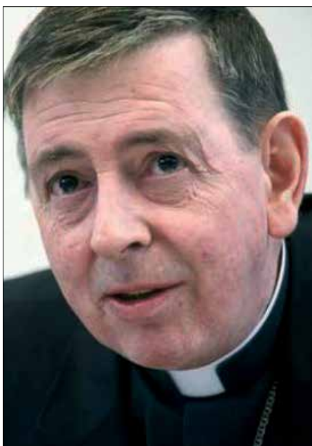
☞ Kardinál Kurt Koch