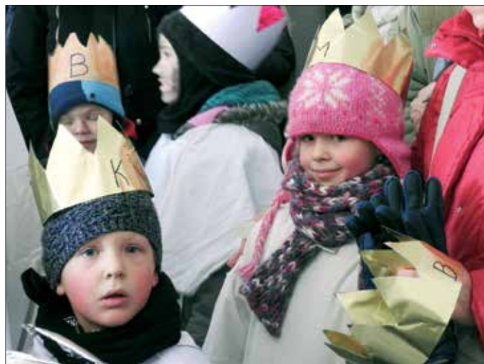
(Tříkráloví koledníci z Kutné Hory.)

Charity pro vás připravily i spoustu doprovodných akcí , často ve spolupráci s farnostmi – tříkrálové koncerty a průvody, živé