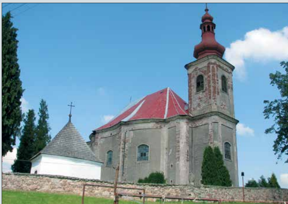
Ⓜ Kostel sv. Anny ve Vížňově před opravou, zdroj: wikipedia.

Aby se široká veřejnost o zdevastovaných barokních kostelech na Broumovsku dozvěděla, zahájil 1. prosince, opět ve prospěch „svých“ duchovních stánků, premiérovou vernisáž fotografické výstavy Tempus fugit na Moravě, v olomouckém klášteře dominikánů. Jedná se o vůbec první tuzemskou prezentaci výstavy po jejím návratu ze Severní Ameriky. Fotografie bratislavského fotografa Dana Veselského se snaží poukázat na neutěšený stav broumovské skupiny kostelů. Dosud byla už na jednadvaceti místech dvou kontinentů, přinesla množství kontaktů a nasbírala tři sta tisíc korun.