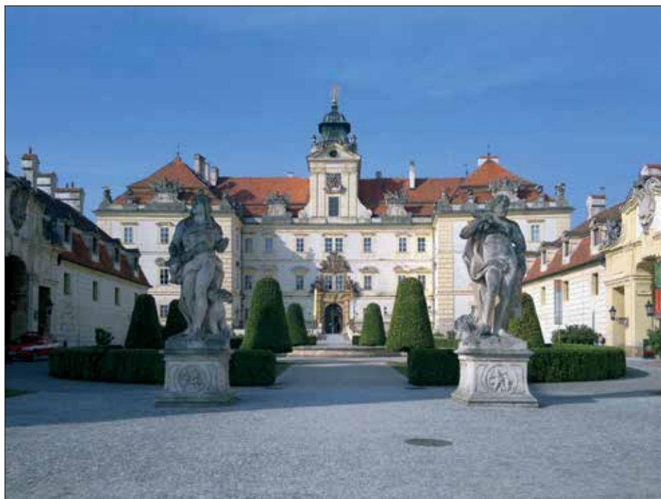
Po ukončení pustošivé třicetileté války přišla doba baroka, která přinesla nové impulsy architektuře, malířství i sochařství. Na snímku barokní areál ve Valticích.

Dostáváme se v našich úvahách ke klíčovému letopočtu 1918. V tomto roce uplyne 100 let od konce první světové války, rozpadu Habsburské monarchie a vzniku samostatného Československa.