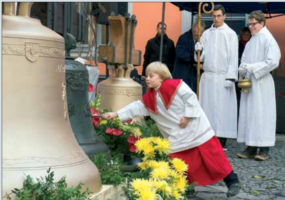
◀ Momentka ze svěcení zvonů