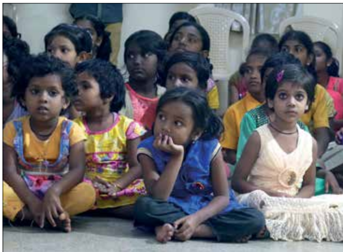
Večerní vzdělávání v Bangalore

vysvětil. Procházíme jím v poledním ostrém slunci, které prostupuje nejen okny, ale i proskleným křížem ve střeše, odkazujícím k inspiraci v Orlických horách. Stejně jako kopie soch z Neratova. Panny Marie, jíž byly připisovány četné zázraky, a sv. Josefa. Byla to smělá myšlenka, postavit takový kostel na chudém indickém venkově.