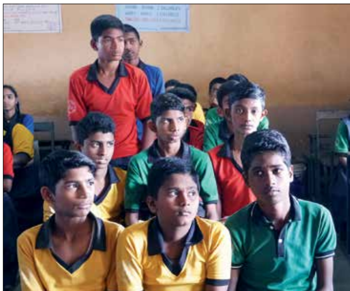
◀ Základní škola sv. Antonína v Belgaum