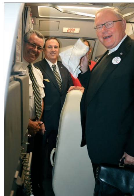
◀ Zkušený poutník...