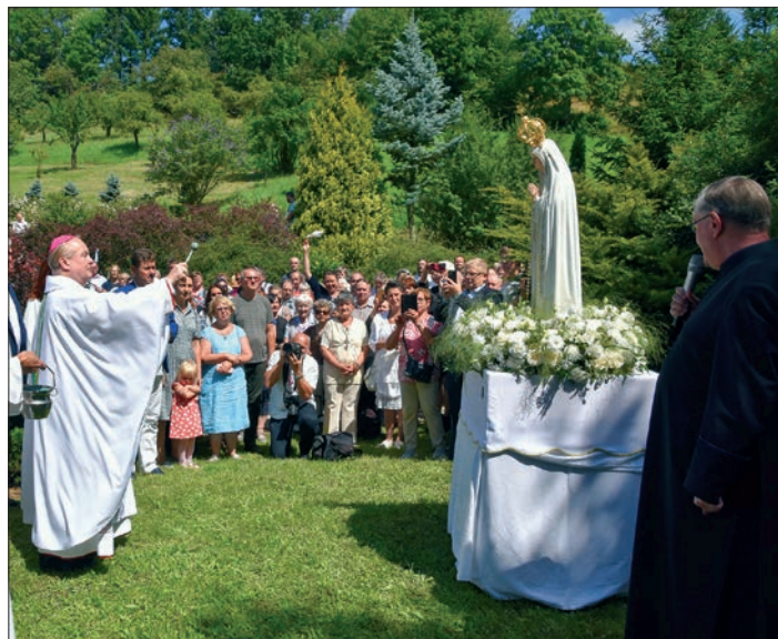
Ⓛ Vše o stavbě nové kaple na www.capelinha.cz

i ve chvíli smrti. Jeho osobního druhého příchodu pro mě.