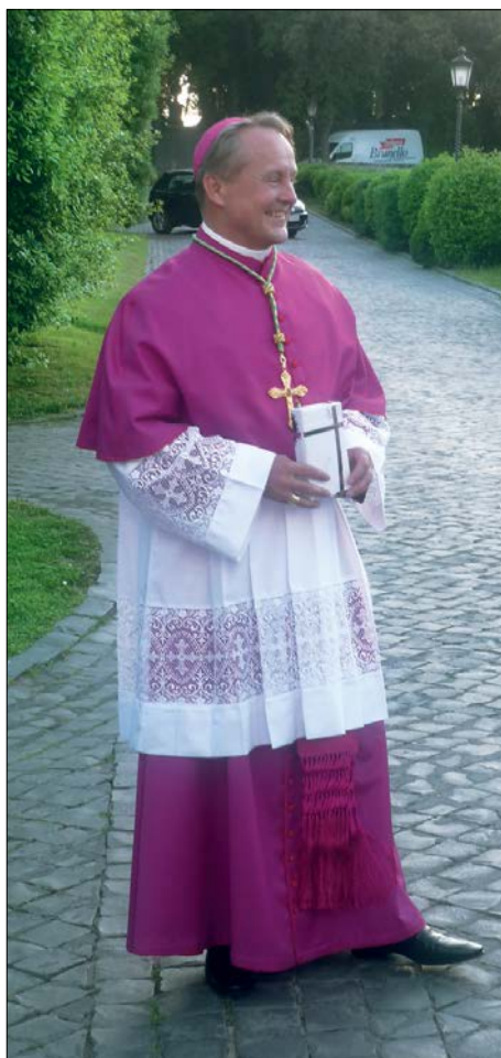
☛ Ve vatikánských zahradách po biskupském svěcení

navštívit milovaného biskupa Karla Otčenáška. Chtěli přispět na opravu biskupské rezidence, její rekonstrukce teprve začínala. Pan biskup nás provedl po rezidenci, ukázal nám práce, které byly v běhu, vzal nás také do kaple sv. Karla Boromejského.