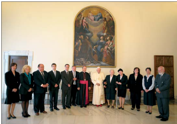
◀ Audieace rodiny a přátel biskupa Jana Vokála u Svatého otce Benedikta XVI.