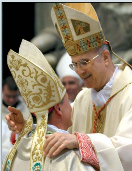
Ⓛ První bratrské pozdravení v biskupské službě se světitelem kardinálem Tarcisiem Bertone

Munus sanctificandi. Třetí funkce má původ ve sdílení kněžství s Kristem samým. Při vykonávání vlastní služby je každý