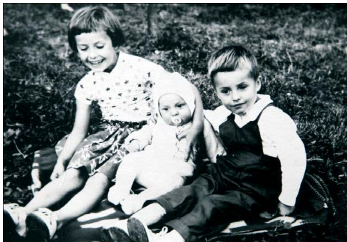
(V dětství se starší sestrou a mladším bratrem