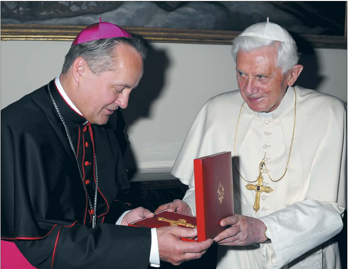
◀ Převzetí pektorálu od papeže Benedikta XVI.

němčina, žádná velká sláva. Ale podařilo se mně koupit si v Benátkách, za vyměněné německé marky, jízdenku na vlak do Říma. Pamatuji, že ta cesta byla pro mě skoro dramatická. Z dob, kdy jsem vyrůstal, jsem byl zvyklý, že všechno se muselo dělat tajně, opatrně. Takže když jsem v tom vlaku z Benátek do Říma uviděl průvodčího v uniformě, kterou jsem neznal, předpokládal jsem, že je to policie, která po celé Itálii hledá Jana Vokála, který právě emigruje. Časem jsem si uvědomil, že Italové to zas tak neberou, že by hledali všechno, jen ne mě, dnes se tomu směju. Do Říma jsem přijel ve večerních hodinách a taxikáři před nádražím jsem nadiktoval adresu, kam bych chtěl být zavezen. Byla to tehdy československá kolej Nepomuceum, seminář pro české a slovenské studenty. Z vysílání vatikánského