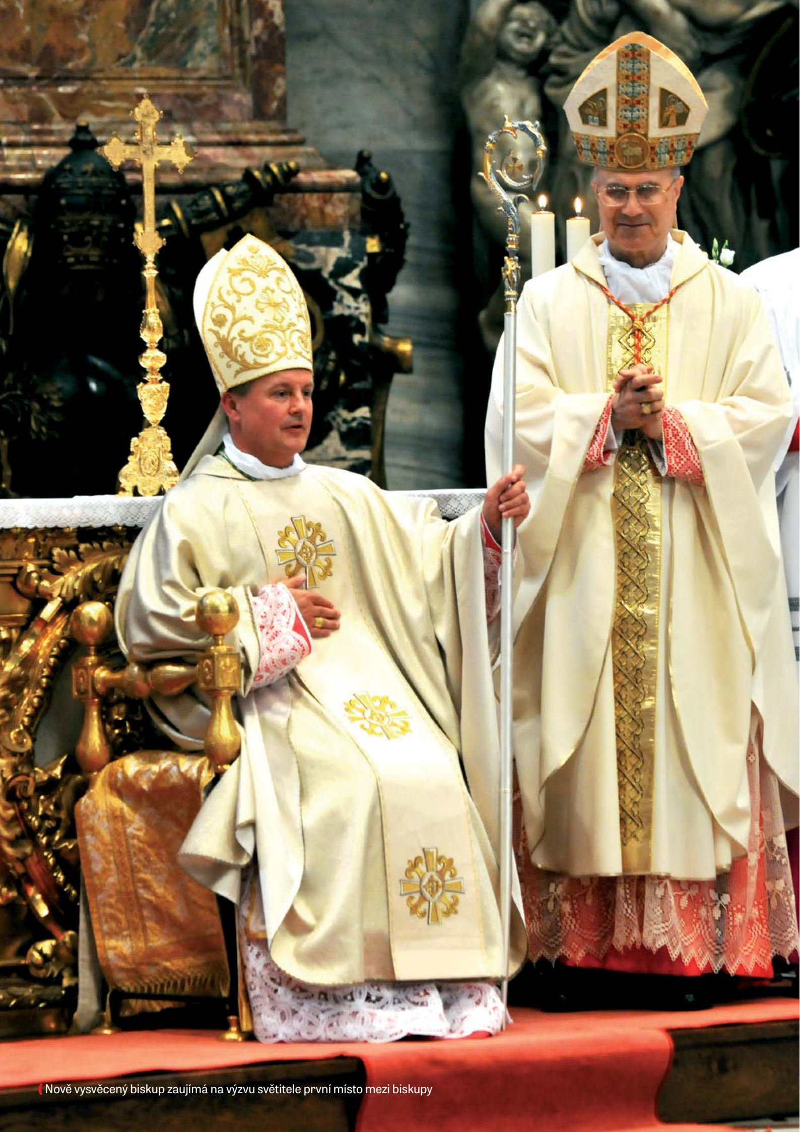
Nově vysvěcený biskup zaujímá na výzvu světitele první místo mezi biskupy