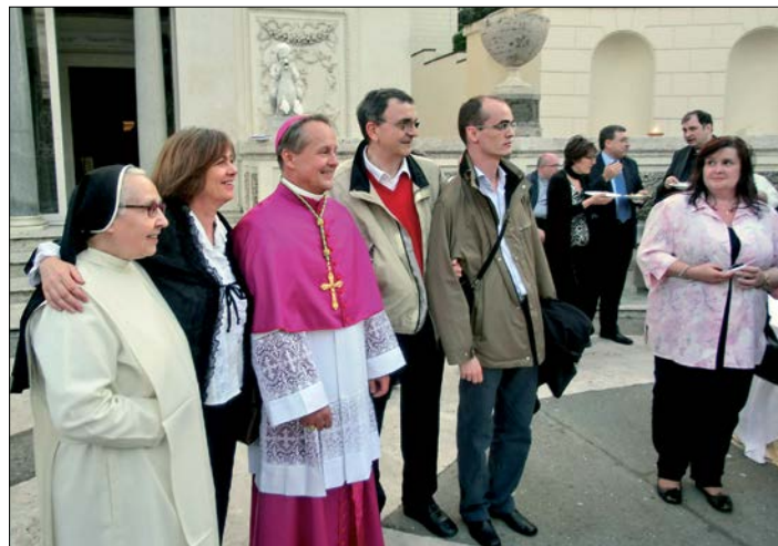
◀ S přáteli při recepci ve vatikánských zahradách

vycestovat do vytoužené Jugoslávie. Povedlo se, jako studentům nám to povolili. Jeli jsme do Umagu, což je přístavní město na severozápadě chorvatského poloostrova Istrie. Tam jsem od první chvíle myslel jen na to, jak se dostat do zájezdu lodí do Benátek. Vědělo se, že ty zájezdy existují. Italská policie společně s jugoslávskou odebrala jejich účastníkům pasy a dostali jenom zvláštní povolení k prohlídce města. V něm se zavázali, že se do večera vrátí na loď v přístavu v Benátkách. Já jsem si nic neprohlížel, protože jsem se snažil dostat co nejrychleji,