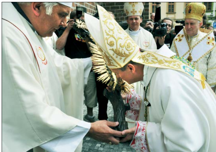
Uctění vzácného kříže z hory Tábor ve farnosti Lomnice n. Pop. při biskupské intronizaci v Hradci Králové 14. 5. 2011

Podle naší víry je bázeň Boží jeden z darů Ducha Svatého, bázeň Boží. To je myšlené ne jako strach, ale jako obava, abych neztratil Boží přízeň svojí vinou. Abych hříchem nebo nedbalostí se nějak nevzdálil Bohu. V tomto smyslu mluvíme o tzv. bázni Boží jako daru Ducha Svatého. Tak samozřejmě, že se v bázni Boží snažím žít a že to vidím jako pozitivní věc. Tíha zodpovědnosti, tu cítím pořád, a myslím, že ji budu cítit stále víc.