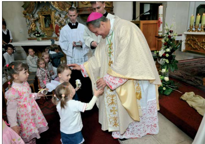
☛ Do rodné farnosti v Hlinsku se vrací 25. královéhradecký biskup vždy rád

pasu. Začal jsem chodit na kurzy italštiny, potom postupně na některé předměty na filozofickou fakultu na Lateránské univerzitě, po bakaláři z filozofie jsem začal studovat teologii. Byl jsem poslán do USA, každý rok na tři měsíce, abych se učil řeč, ale i z praktických důvodů, kolej se v létě zavírala a škola taky. Takže čtyři roky jsem jezdil na prázdniny do Texasu. Když mě biskup Jaroslav Škarvada vysvětil v červenci 1988 v Německu na jáhna, byl jsem pak rok na praxi v USA. Tam jsem měl vždycky týden školy a týden praxe ve farnosti. Škola, to byly kurzy teologie na Univerzitě sv. Tomáše v Minneapolis. Po necelém roce jsem jel na kněžské svěcení do Říma, Jan Pavel II. mě vysvětil 28. května 1989. Tady už se schylovalo k sametové revoluci, což jsem já samozřejmě nemohl tušit. Do Spojených států jsem se vrátil s tím, že už tam zůstanu a budu působit. První roky vyložené jenom pro Američany a později, že bych pracoval s Čechy. Uprchlíky, emigranty, starousedlíky, měl jsem působit mezi krajany v USA i v Kanadě. Jako farní vikář jsem byl asi půl druhého roku ve státě Illinois, to bylo krásné.