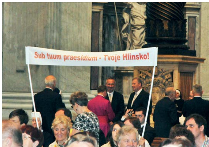
Ⓛ Bazilika sv. Petra, u oltáře Katedry, setkání budoucího biskupa s věřícími z rodného Hlinska před obřadem svěcení