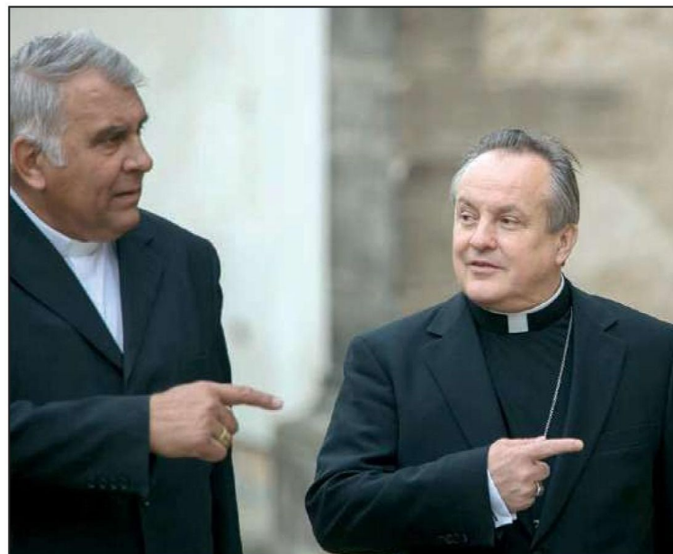
Ⓛ Aby život v diecézi běžel správně, musí jít všichni jedním směrem

každý budoucí kněz úctu a poslušnost svému biskupovi. Z tohoto se musí vycházet. Stejně jako generál si svoje vojsko rozmísťuje podle dané potřeby a situace, tak i biskup má právo podle svých nejlepších plánů rozmístit kněze, kteří mu všichni slibovali poslušnost, podle jejich schopností, podle daných možností. Dnes se to celkem daří, ale na začátku to bylo často s velkým nepochopením. Důležité je, aby se lidem vysvětlovalo, že se nejedná jen z pozice autority. Já chápu, že je to v dnešní době neobvyklé, a pro mnoho lidí i nepochopitelné, ale takto to v církvi je. A když toto kněží pochopí a vysvětlí lidem, tak i oni to velmi rádi přijmou.