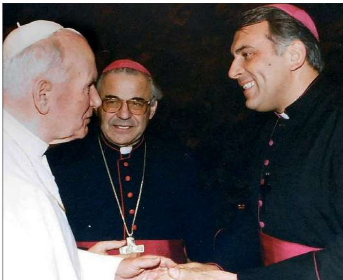
Na audienci s kardinálem Vlkem u papeže Jana Pavla II.