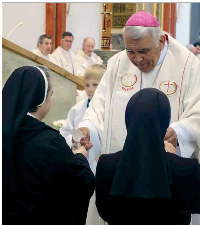
Biskup Josef Kajnek je také biskupským vikářem pro duchovní povolání