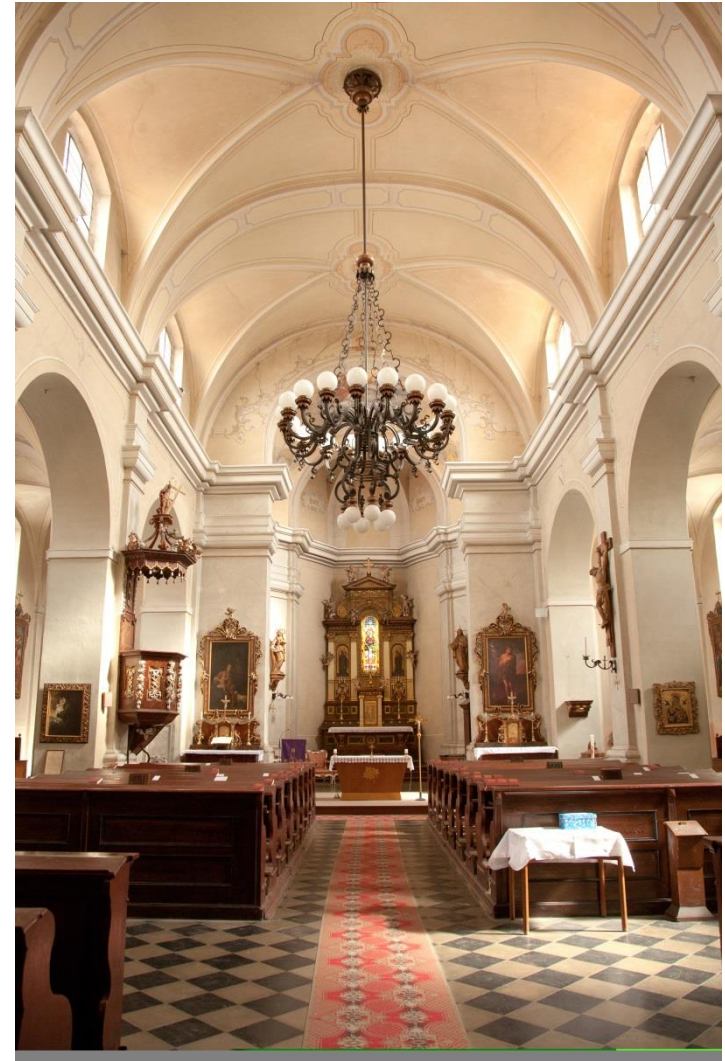
... a nyní